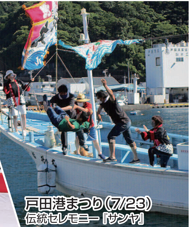
戸田港まつり(7/23) 伝統セレモニー『サンヤ』