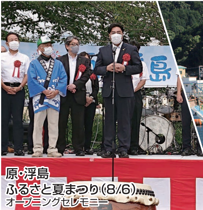
原・浮島 ふるさと夏まつり(8/6) オープニングセレモニー

No. 123 発行者 沼津市商工会 会長 渡邊好孝 〈本所・原支所〉沼津市原1200番地の1 TEL(055)966-1331 FAX (055)967-4925 〈戸田支所〉沼津市戸田1028番地の5 TEL(0558)94-2224 FAX (0558)94-4029 編集 沼津市商工会広報委員会