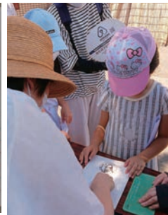
スタンプを押す子供