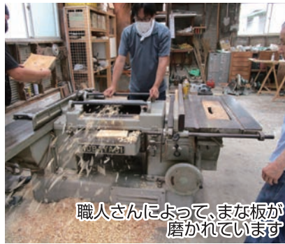
職人さんによって、まな板が磨かれています

この日は、地区内の飲食店や旅館等の依頼を受け、合わせて71枚のまな板を磨き上げました。