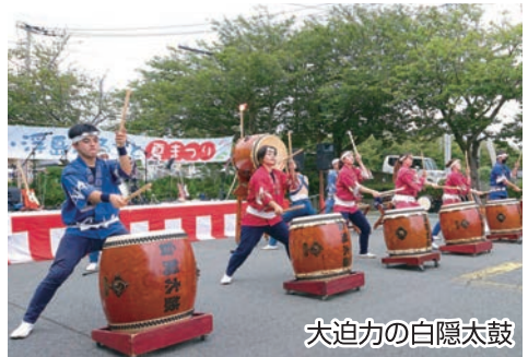
大迫力の白隠太鼓