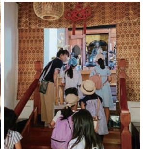
白隠禅師尊像を見学