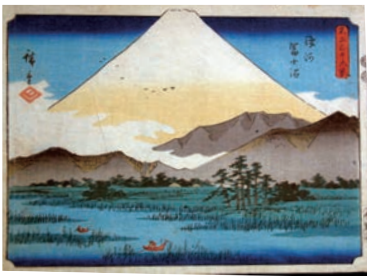
初代歌川広重画 「不二三十六景 駿河 富士沼」