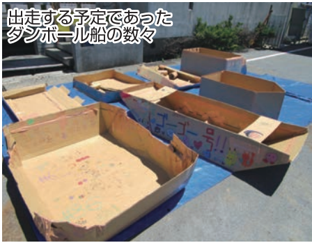
出走する予定であったダンボール船の数々

昨年、一昨年と新型コロナウイルス感染症の影響で見送られ3年振りの開催となりましたが、ロシアのウクライナ侵攻によるパレードや慰霊祭の中止、直前のコロナ再拡大による一部イベントの中止など、異例づくめとなりました。特に戸田港まつり名物の商工会青年部主催「海上ダンボールレース」については、過去の最大の20組の出場が予定されていたため、直前の中止に残念がる声も聞かれました。